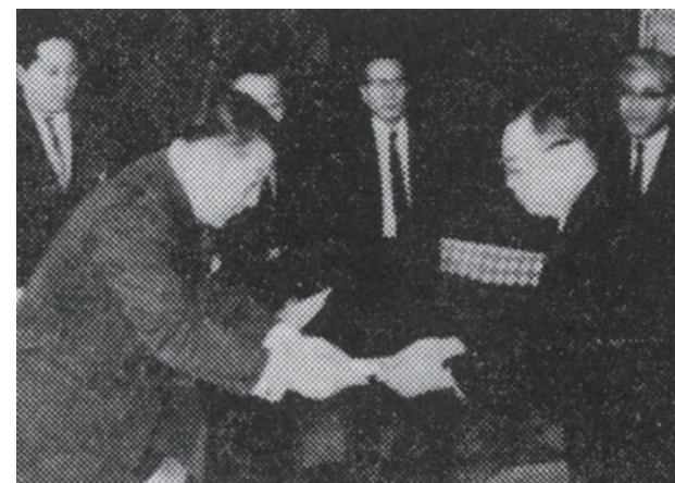
1968年、「がんの子供を守る会」へ、小児がん治療助成金の寄付を開始。1983年までに10億円を寄付