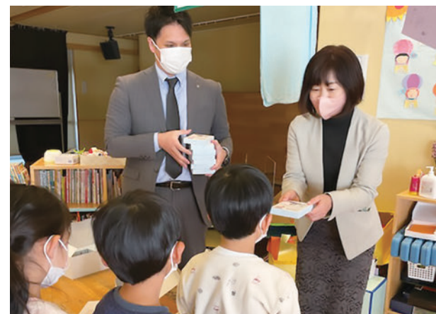
2021年、「THE MUTUAL」おやさいくれヨンを全国の保育園等に寄贈

▶おやさいくれヨンの詳細は「100周年プロジェクト (13、14ページ)」を参照