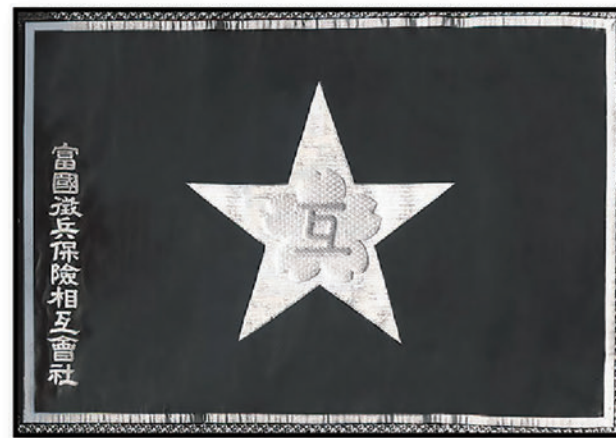
創業当時の社旗 中心には相互組織であることを表す「互」を刺繍